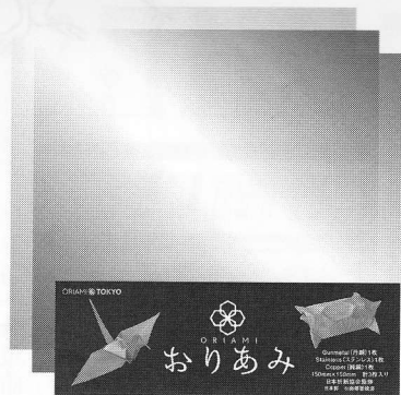
大きさは通常の折り紙と変わらない