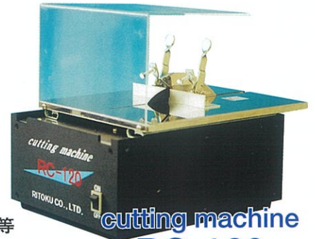
cutting machine RC-120