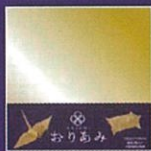
サイズ 180×180mm カラー (金色丹銅) 1,320円(税別) 3枚入り