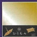
サイズ 150×150mm カラー (金色丹銅) 1,100円(税別) 3枚入り

◎素材はステンレス・銅・丹銅など、素材によりORIAMIの色味が変わります。 ◎紙の折り紙同様折りたたみ展開したりしてご利用いただけます。 ◎一般的な折り紙同様の使い方の他、箱やアクセサリなどにも応用でき、幅広い使い方ができます。